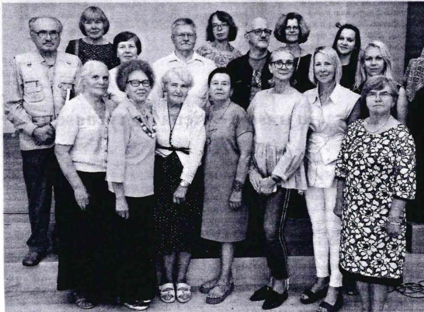
Tėviškėnų klubo valdybos nariai ir svečiai.