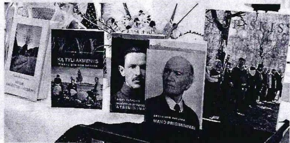
Vilniaus kupiškėnų klube pristatytos neseniai išleistos „Kupiškėnų bibliotekos“ serijos knygos.

Vilniaus Mokytojų namuose prieš kelias savaites popietėn buvo susirinkę Vilniaus kupiškėnų klubo nariai.