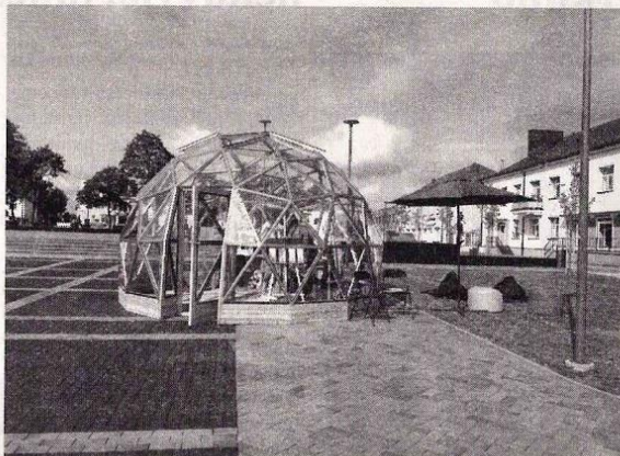
Geokupolo miesto aikštėje sunku nepastebėti.