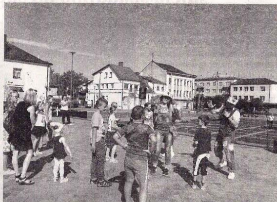
Panevėžio teatro „Menas“ aktorių pasirodymas rugsėjo 1-ąją dieną buvo ypač nuotaikingas.