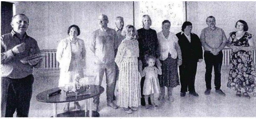
Leidinių sudarytojai ir autoriai.