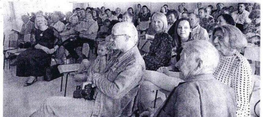
Dviejų kupiškėniškos tematikos leidinių sutiktuvėse dalyvavo nemažai kupiškėnų.