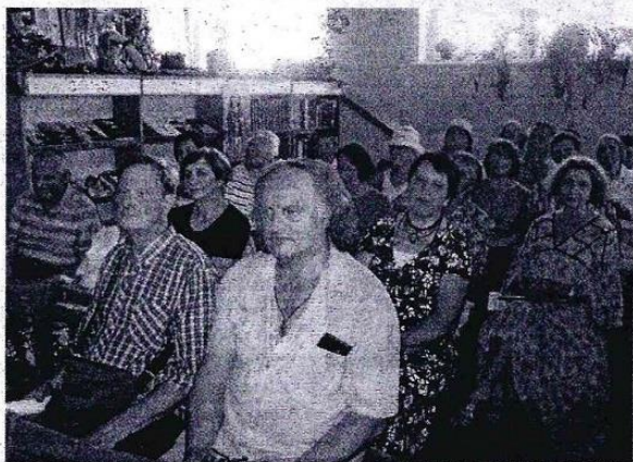
Į bibliotekos salę susirinko literatai iš Aukštaitijos regiono.