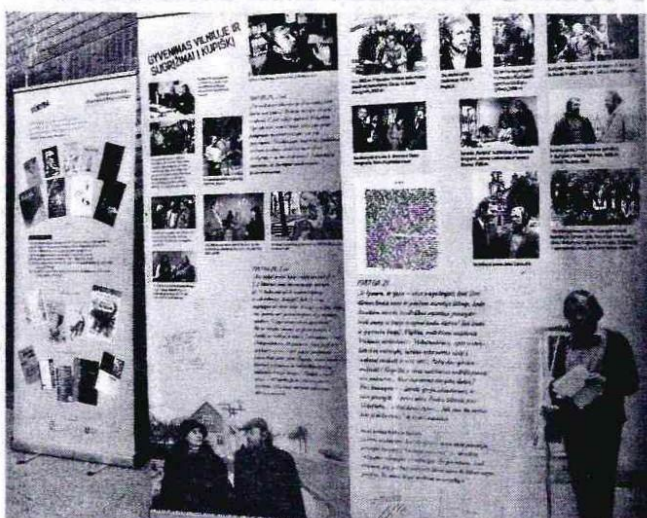
Pristatyta mobili fotografijų ir dokumentų parod