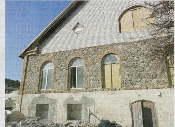
Kupiškio viešosios bibliotekos (buvusio sinagogos pastato) rekonstrukcijos darbai tęsiasi.