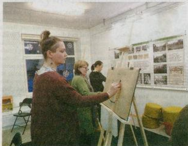
Kupiškio viešojoje bibliotekoje sausio vakarais vyksta dailės užsiėmimai suaugusiesiems.