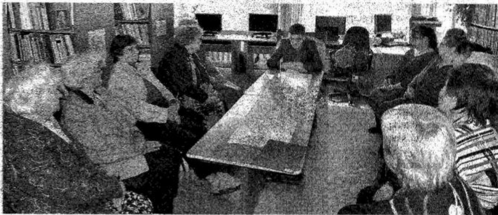
Justo Jasėno knygos pristatymas Virbališkiuose.