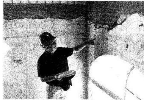
Atnaujinti bibliotekos interjerą bus palikti prieškarinio sienų dekoru fragmentai.