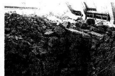
Iš griuvusių renkamos ir rūšiuojamos prieškarinio laikų plytos bus vėl panaudotos mūrijanti pastato skliautas.