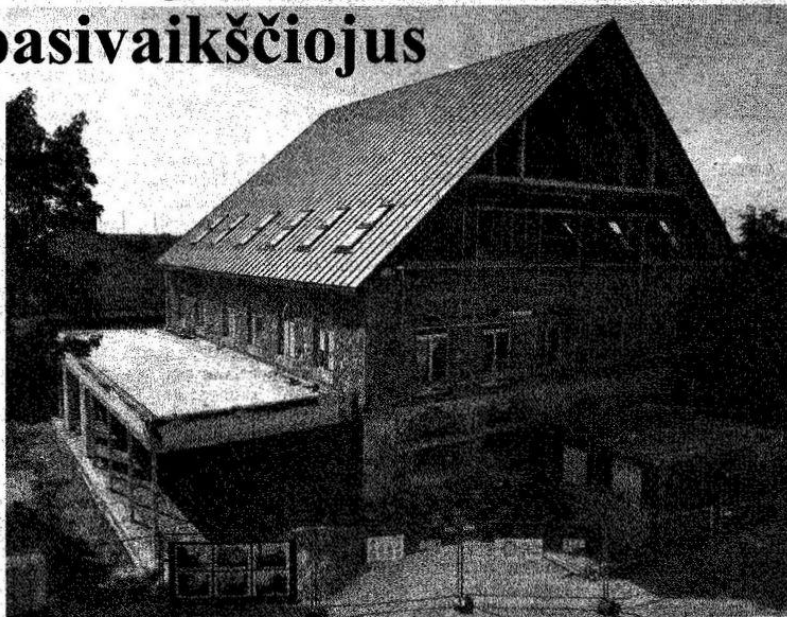
Buvusios sinagogos pastatas, kur po rekonstrukcijos vėl įsikurs Kupiškio rajono savivaldybės viešoji biblioteka, sparčiai keičia savo pavidalą.

Užsidedę statybininkų šalmsi žengėme pro dvivėres duris tiesiai į buvusią didžiąją bibliotekos salę. Jos pokyčius kupiškėnai jau regėjo. Iš toli visu gražumu švyti akmeninės pastato sienos, nušveistos smėliu ir impregnuotos. Dar šiame pastate tebeveikiant bibliotekai buvo išgraižta skaitytokios siena, padarytas dalį patalpų juosiantis balkonas.