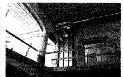
Pirmame aukšte įrengus kai kurias perdangas vis tiek išliks atvira erdvė. Ją planuojama pritaikyti ir koncertams bei kitoms renginiams.