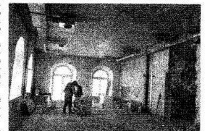
Buvusioje skaitytųjų aptarnavimo patalpoje po rekonstrukcijos bus konferencijų salė.

Ergetas Alonius-Andrijauskis nuobulos išlikusių polichrominio sienų dekoru fragmentų, akmeninių sienų, gal dar to meto kai kurių durų, šiuo metu daugumą nieko, dvelkiančio senove, nebėra.