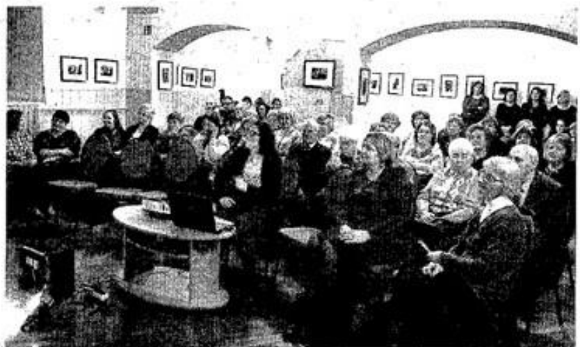
Bibliotekos renginio svečiai.