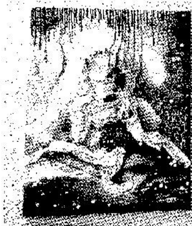
Lenos Zinlenės dviejų paveikslų kompozicija „Šlapdrība“.

Pradėtoje atnaujinti Kupiškio viešojoje bibliotekoje vasario 17 dieną atidaryta kasmetinė penkioliktąjį rajono mokyklų dailės mokytojų ir jų draugų dailės kūrybos paroda „Kūrybos erdvės 2017“. Šiemet šios parodos tema buvo „Ko žodžiais nepasakysi“. Taigi autoriams, ir ne tik jiems, suteikta visiška Improvizacijos laisvė.