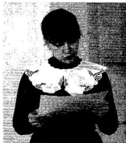
...Ir apranga renginiui pritaikyta.

Verta ateiti į biblioteką, pasimatymas su praeitimi bus įdomus.